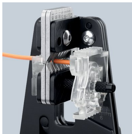
Sauberes Einschneiden der Isolation auf dem gesamten Umfang