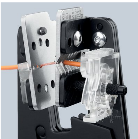
Formschlüssiges Abisolieren durch präzise Messerprofile

Kapton® ist ein eingetragenes Warenzeichen der E. I. du Pont de Nemours and Company Radox® ist ein eingetragenes Warenzeichen der Huber & Suhner AG