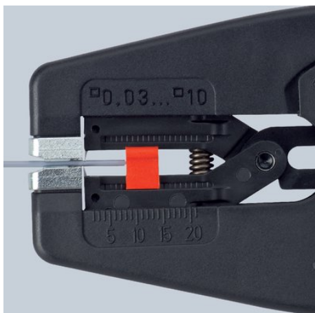
Klemmbacken aus Stahl verhindern ein Durchrutschen des Leiters