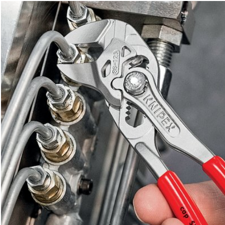
der Mini-Zangenschlüssel für feinmechanische Arbeiten