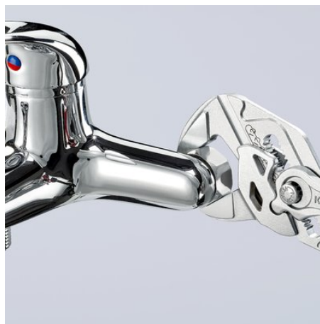
Arbeiten auf verchromter Armatur, ohne Beschädigung der Oberfläche