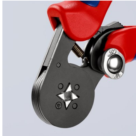
Das Wechseln der Crimpkapazität von 10 mm 2 auf 16 mm 2 erfolgt durch ein einfaches Umschalten.