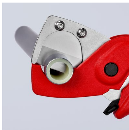
Das hochfeste, scharfe Messer schneidet Verbund- und Kunststoffrohre glatt und gratfrei