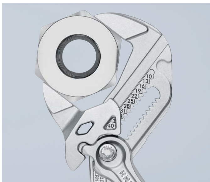
Schlüsselweite metrisch (Vorderseite) und zöllig (Rückseite) am Zangenkopf eingelastert